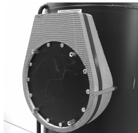
Aislante trasero de la brida fijado