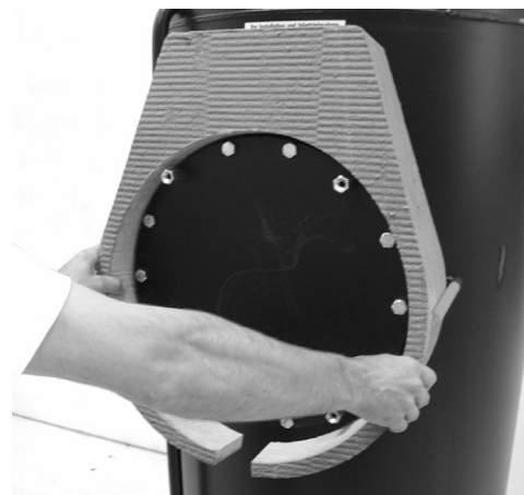
Colocación del aislante trasero de la brida