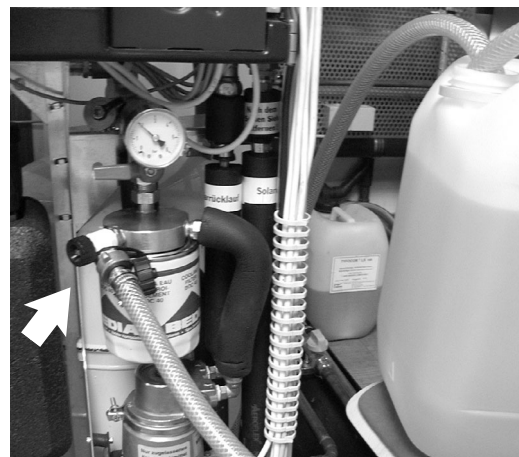
Manguera de llenado conectada al grifo de llenado