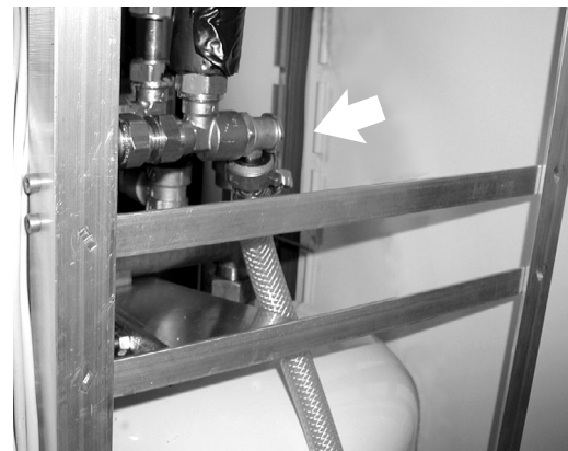
Manguera de lavado conectada al avance solar